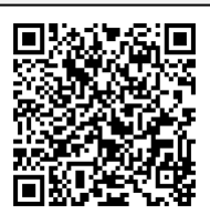
Infografía CENAPRED: "Peligro, Tornado"