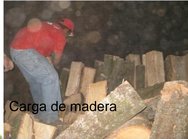
Carga de madera