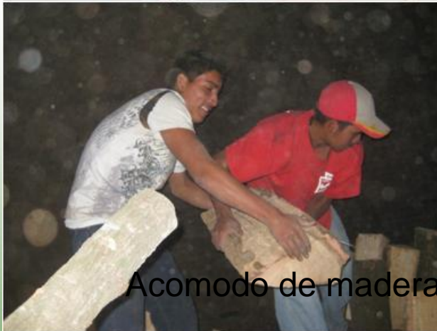
Acomodo de madera