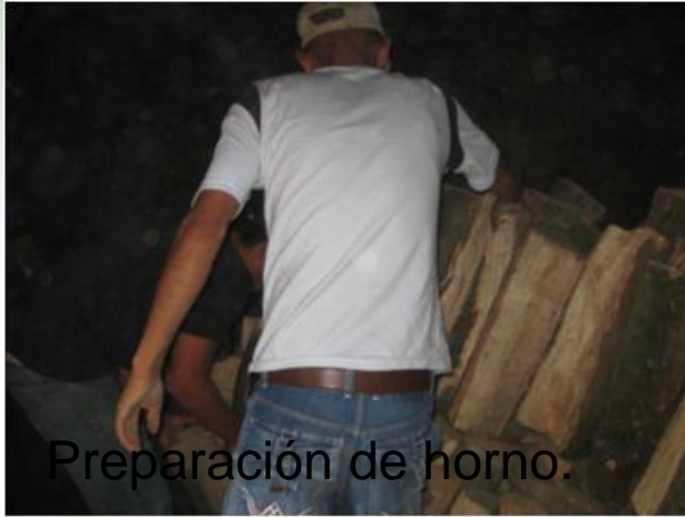
Preparación de horno.