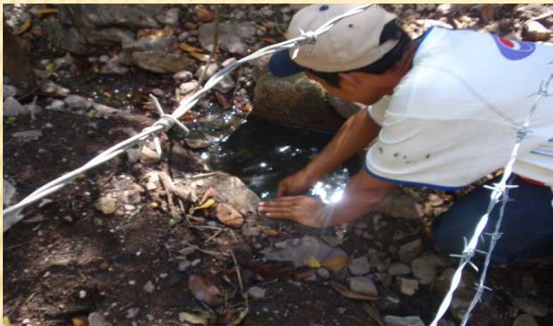
Mantenimiento de ojos de agua