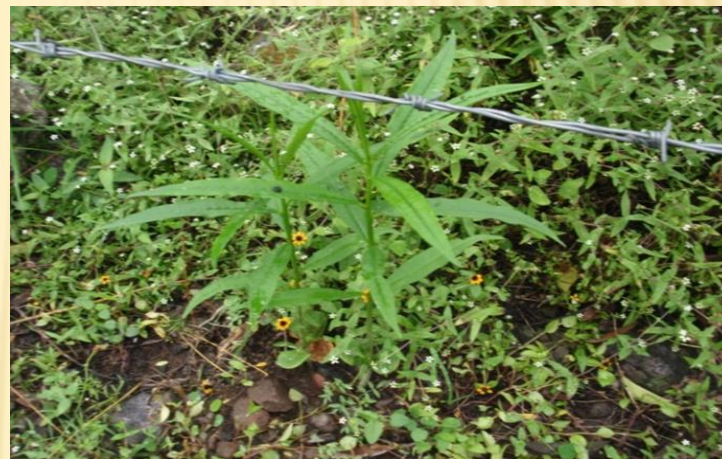
Establecimiento de cercos vivos por semilla