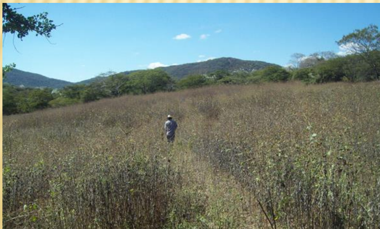
Establecimiento de bancos de proteína