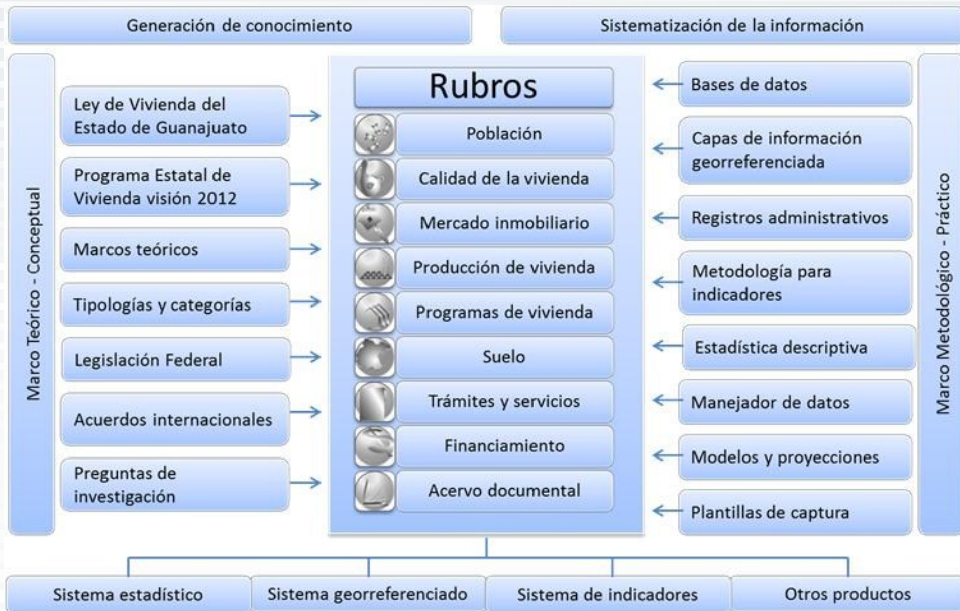
Figura 3. Estructura operacional de la información en el SEISV